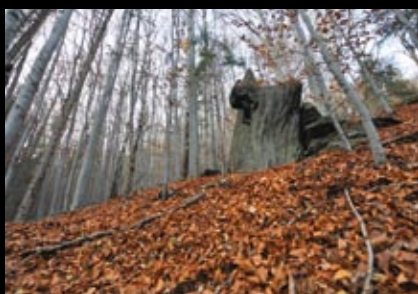
Jara Bíl, Kaz (5B), Zub, sektor Green

Kaskádový sektor Green potěší svým potenciálem jak jinak než siláky, ale pro změnu má v repertoáru i několik plotýnek pro technické lezce. Najdete zde první očistěný kámen mladou generací Konec sezóny. Po přeлезení linky Top numero uno (6B) kluky motivoval do dalšího objevování bouldrových možností v místních skalách. Na kameni Oltaro pak stojí za zmínku technická kolmice Sonic (6B) nebo sousední nízký stropík s projektem ko-